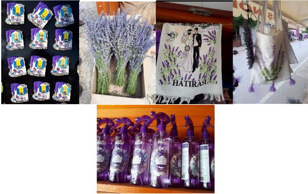
Fotoğraf 3. Lavanta demeti, lavanta desenli bez çanta, havlu, magnet, lavanta kokulu oda parfümü (Ceylan®)

Sadece lavantanın (kendisi) değil, bunun yağının çıkartılması da var, zaten burda (Akçaköy’de) yağı çıkartılıyor. Diğer taraftan yağının ekolojik olarak üretilip yurt dışına satılmasıdır, ilaçsız tarımla. Sonra lavantanın turizme kazandırılmasıdır. ... Burda (tıbbi aromatik bitkilere dair) her şeyin üretimi var. Burda parfüm üretimine kadar. Şu an Türkiye’nin en gelişmiş (lavanta işletim) sistemi burda. ...Burda katma değerini tamamı yaratılıyor. Fazla olan (lavanta) yağını biz satıyoruz. Mesela bu yıl da biz Hollanda’ya lavanta demeti satışımız vardı. Gelecek yıl da İngiltere’ye var, kuru çiçek demeti olarak, onlar tekrar onu boyuyor (K3).