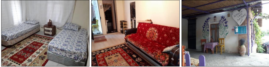
Fotoğraf 6. Kuyucak'ta K15 kodlu katılımcının 7 yataklı ev pansiyonundan görseller

(Turizmin Kuyucak'a katkısı) harika, olmaz mı, çok çok. İnsanların ufkunu açtı. Şurdaki köylünün gerçekten kadınlarımızın, erkeklerimizin insanlarımızın hepsinin ufku açıldı. Ne olacak buraya profesörü de geliyor, her türlü insan geliyor buraya. ...Gerçekten kazanmayan yok, bırak sen bizim köyü, Keçiborlu, Ispartalı, Burdurlu herkes kazanıyor bundan (lavantadan) (K7). ...Ben 1990'dan itibaren ekliyorum. Ben toptan pazarlıyorum tabi aktarcılara. Aktarcılar da onlar da başkalarına satıyor. İstanbul'a satıyorum. ...Köyde (Kuyucak) 200 ton lavanta çıkıyor. ...Herkes kendi çapında (lavanta tarımından) üçer beşer bin lira kazanır yani en az, yıllık. ...(lavantanın) öyle çok da bir getirisi yok. Ama turizm amaçlı oldu mu hiç kazanmayan 5 bin-10 bin lira kazanır. Zaten 1,5-2 aylık mesele bu (turizm). ...Bir aylık 15 günlük işçi çalıştırıyoruz (lavanta tarlasında). ...Geçen sene (biz) 10-15 işçi çalıştırıyorduk (K8).