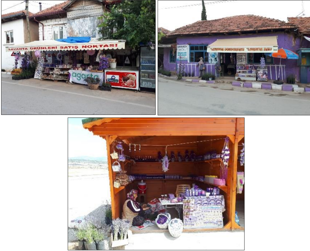
Fotoğraf 4. Kuyucak'ta turistik lavanta ürünleri satan işletmelerden görseller