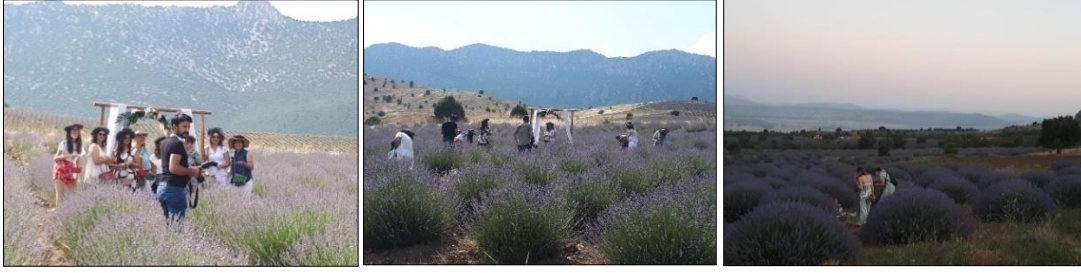
Fotoğraf 2. Akçaköy (sol ve orta) ve Kuyucak'taki (sağ) lavanta tarlalarında fotoğraf çekimleri