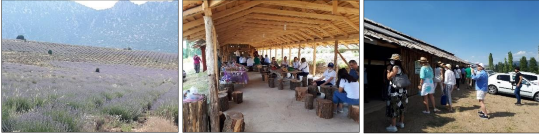
Fotoğraf 1. Akçaköy’de Lavanta Tarlaları ve Lisinia Lavanta Üretim Merkezine Gelen Ziyaretçiler

(köyde) ölüyorum bana bi şunun dolusu bir su ver desen, ovada (köyde) bizde su yok. Bunları (lavantayı) tuttururken bir su veriyoz, Cenabı Allah yağdırırsa. Tuttuktan sonra çok su isteyen bir bitki değil bu. Yani oluyor, kırdaki ek (K9). Bizim arazimiz de içecek suyu zor buluyoruz, köyümüzde. İçme suyunu zor buluyoruz. Kıraç toprak, (lavantayı) bi ekinle kıyaslırsan tabi ki iyi, ama mesela elmayla kıyasladığın zaman kesinlikle (iyi) değil. ...Lavanta, buranın iklimine göre, bir avantaj. ...Bizim buralar kırsal alan, su olmayan arazi (K13). Bizim suyumuz yok oğlum, suyumuz olsa valla daha neler bitiririz şöyle. Var içme suyumuz gine, yetiyor, idare ediyor gayrı, eskiye nazaran da. Öyle işte, tarlalarımızda su yok. Lavantaları Allah sularsa öyle, bizde bir şey yok. Dikerken birazcık su döküyoruz diplerine, tamam o kadar. Bi daha su yok (lavantaya) (K19). Biz de su yok, sulama suyu yok, sulama hiç yok. Sadece içecek suyumuz var, başka bir suyumuz yok (K24).