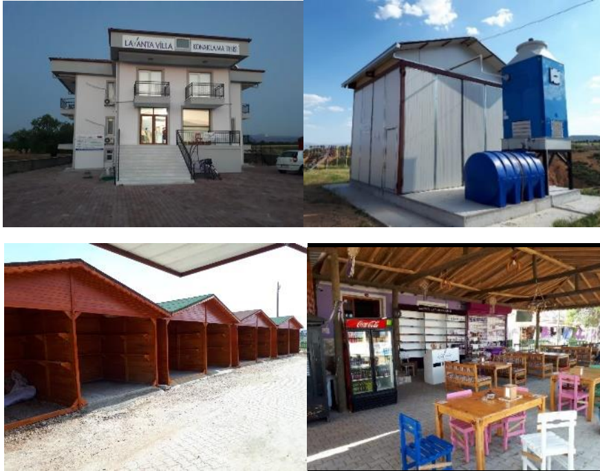
Fotoğraf 5. Kuyucak'ta otel (AB ve TKDK destekli), lavanta yağı tesisi (FAO destekli), turistik ürün satış yerleri (Valilik destekli) ve Kadın Girişimciler Kooperatifi'ne ait kafe işletmesi (UNDP ve Efes destekli)

Akçaköy'de tıbbi ve aromatik bitkiler yetiştirilmesi için, devlet arazilerinin uzun dönemlik olarak köylüye kiraya verilmesi, kamunun kırsal ekonominin desteklenmesi adına yapmış olduğu olumlu bir katkıdır. Kuru (susuz) tarım yöntemi ile köyün çıplak arazilerine ekilen lavanta bitkisi, köydeki buğday tarımı ve hayvancılık faaliyetlerine bir alternatif oluşturmuştur.